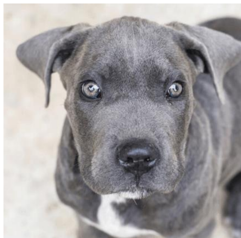
(grey pup > 3 bulan mata kuning kehijauan)