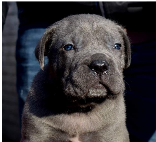
(grey pup < 3 bulan, mata kebiruan)